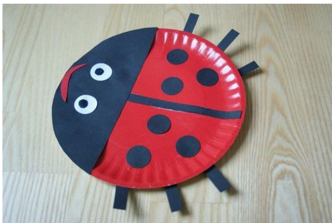
Biedronka z talerzyka papierowego