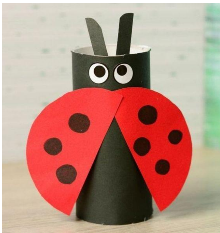
Biedronka z rolki po papierze