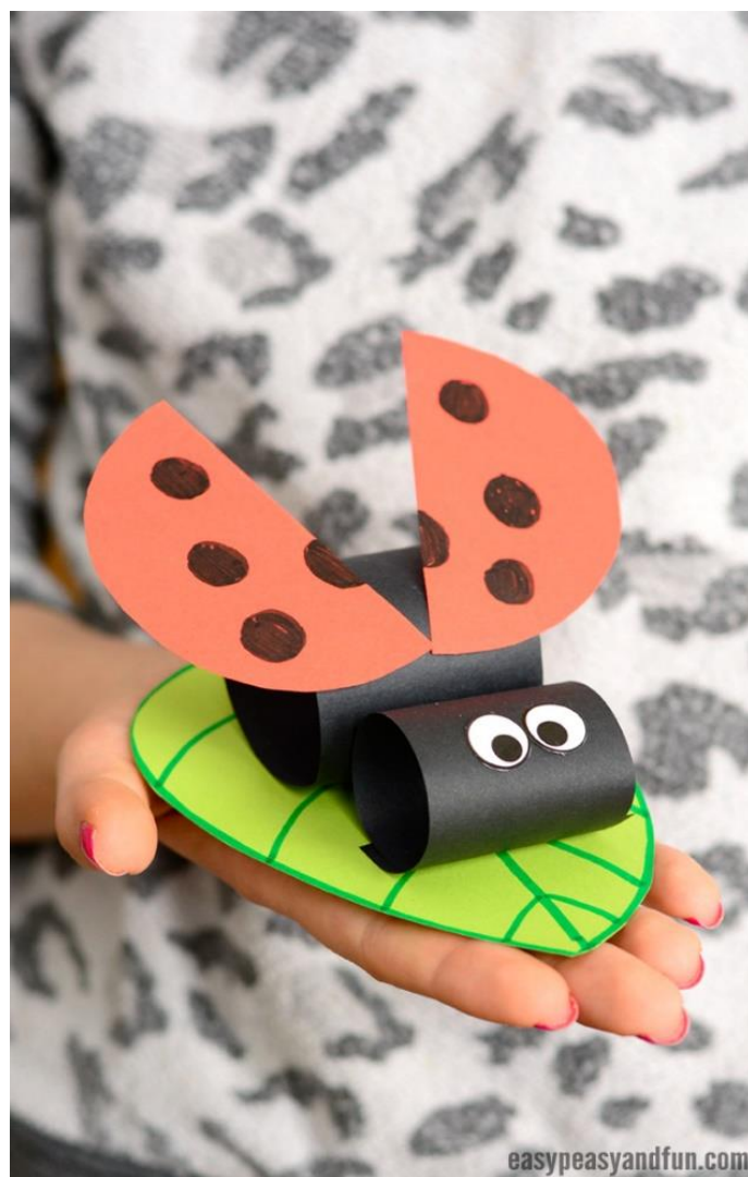
Biedronka z kolorowego papieru siedząca na listku