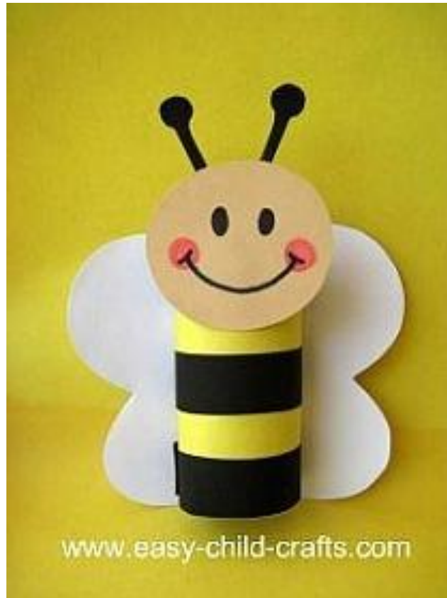
Pszczółka z rolki po papierze

Źródła: podrecznikarnia.pl/przewodnik_metodyczny3_latek/ ; przedszkouczek.pl ; Katarzyna Kowalik-Paluch: Przykłady gier i zabaw stymulujących rozwój mowy dzieci w wieku przedszkolnym; harmonia.edu.pl ; agrofakt.pl ; pl.wiktionary.org ; pl.pinterest.com ; naszadolateczy.blogspot.com ; ekodziecko.com ; dobrzesiebaw.pl