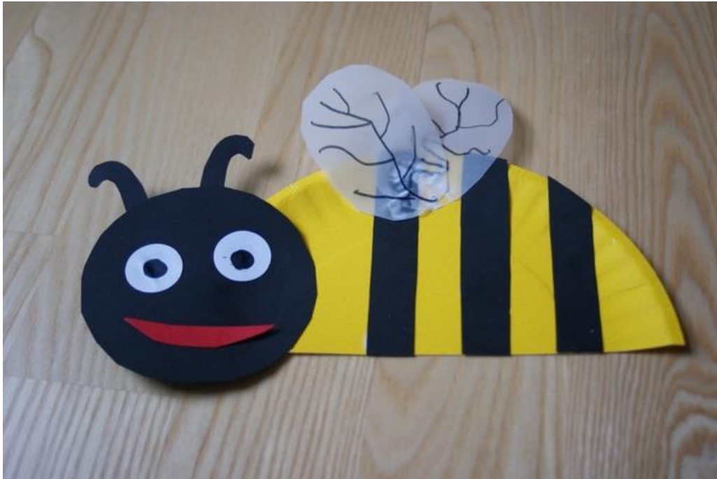
Pszczółki z papierowych talerzyków i kolorowego papieru